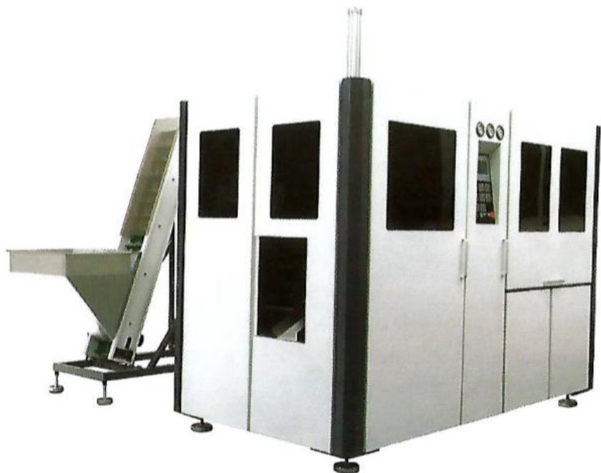
Full-Automatic Blow Moulding