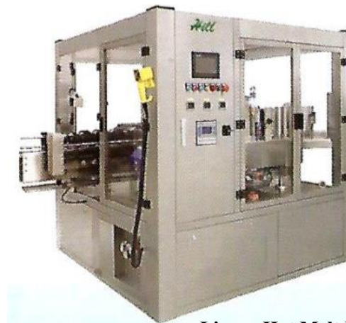
Linear Hot Melt Labeling Machine (OPP)