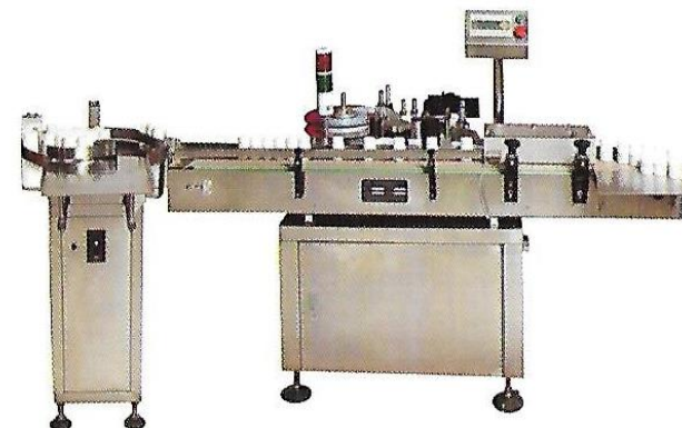
Sticker Labeling Machine