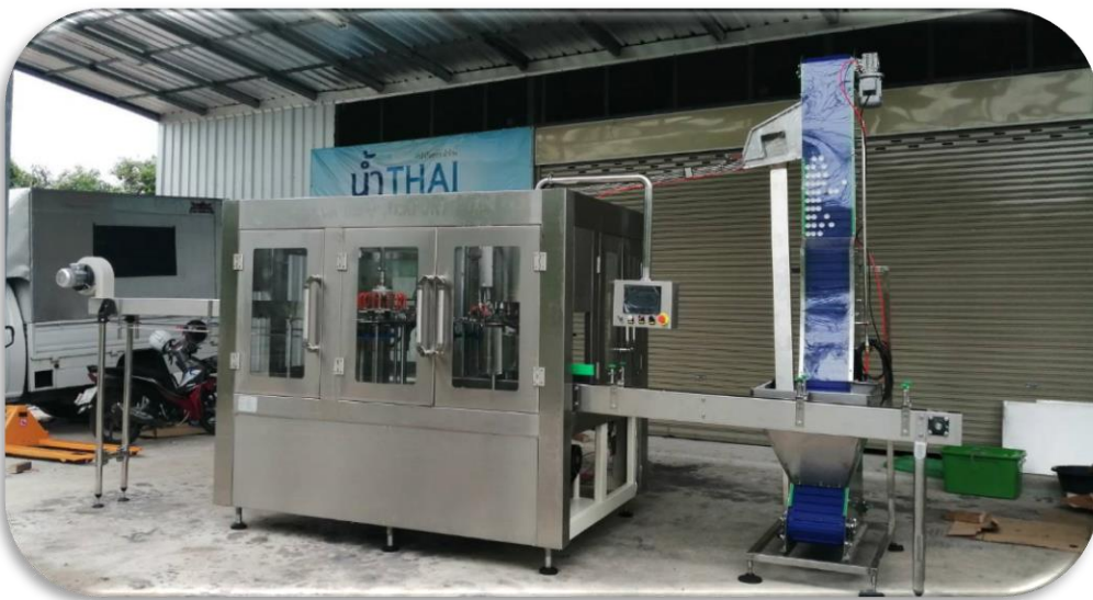
Filling Machine (standard)