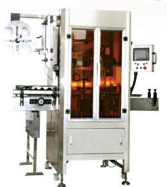
Sleeve Label Machine