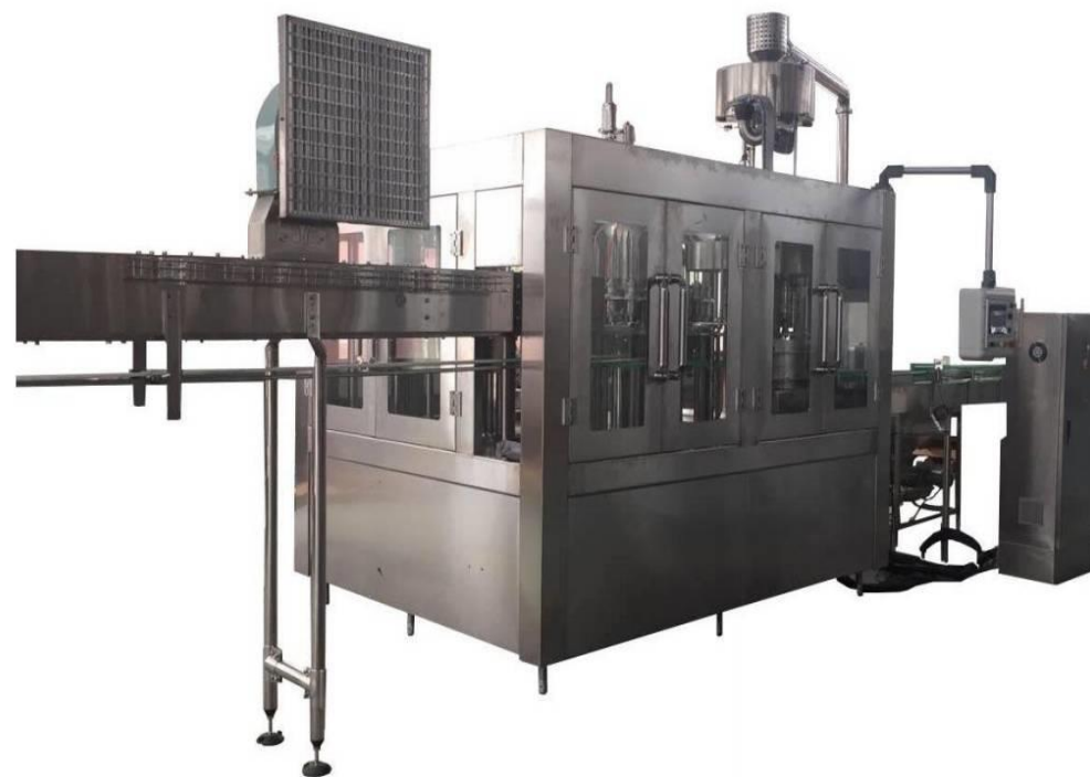
Hi speed Filling Machine

สินค้าของบริษัท ทีพีเอ็ม วอเตอร์ ซิสเต็ม จำกัด