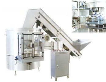
Ordering bottle machine