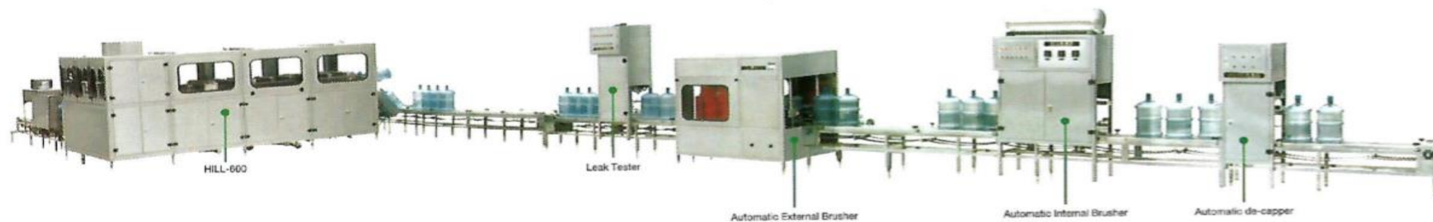
Full Automatic Barrel Package Production Line

สินค้าของบริษัท ทีพีเอ็ม วอเตอร์ ซิสเต็ม จำกัด