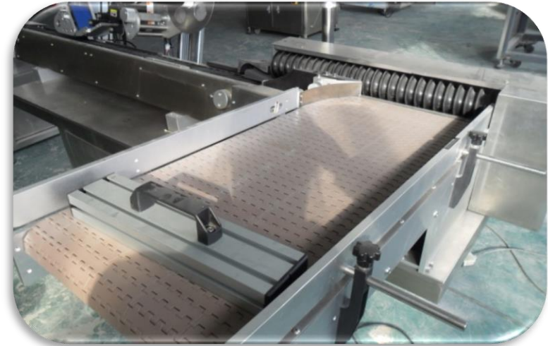
Glass Bottle Unscrambler