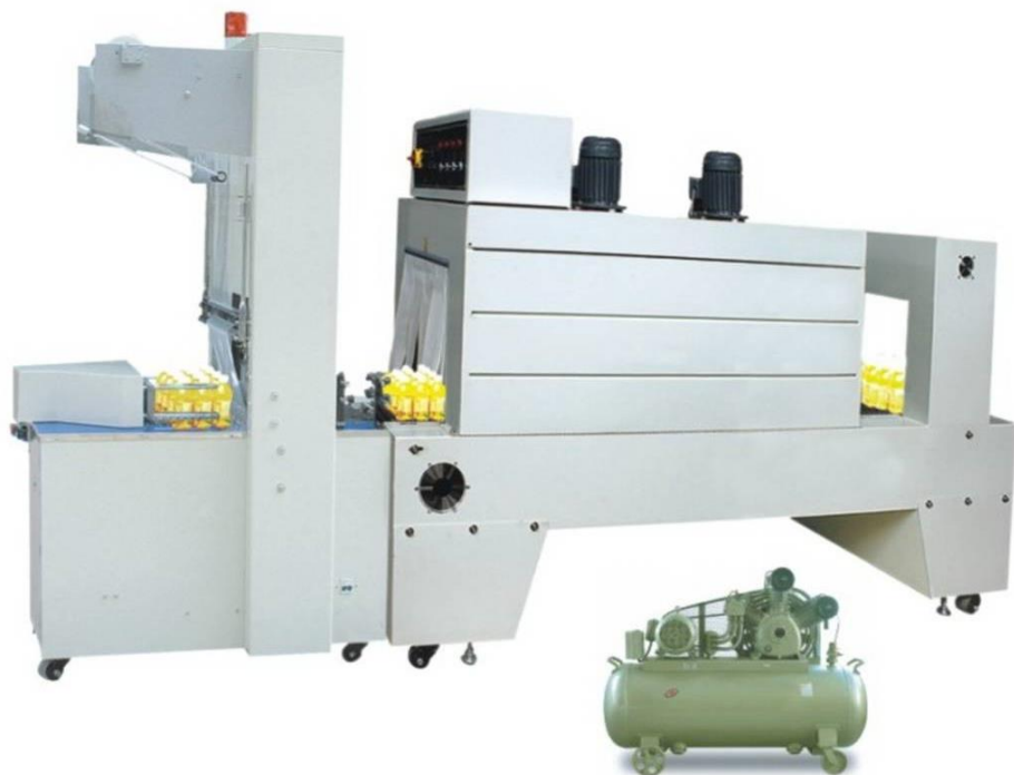
Semi – Wrapping Machine