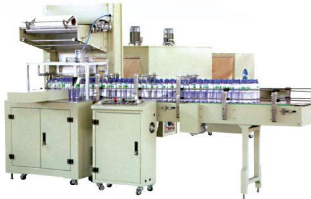
Auto Wrapping Machine