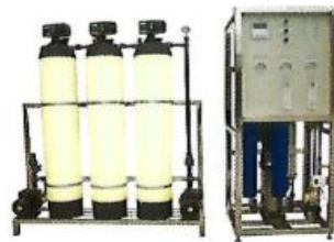
HILL 3000 gpd RO Series of Reverse Osmosis Device