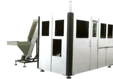
Blow Moulding Machine

สินค้าของบริษัท ทีพีเอ็ม วอเตอร์ ซิสเต็ม จำกัด