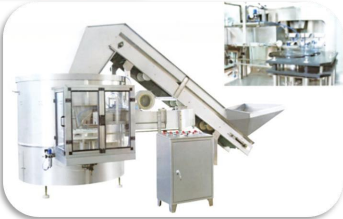
Plastic Bottle Unscrambler