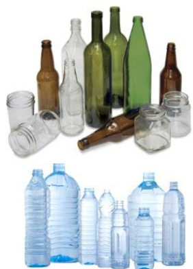
3 in 1 Filling Machine